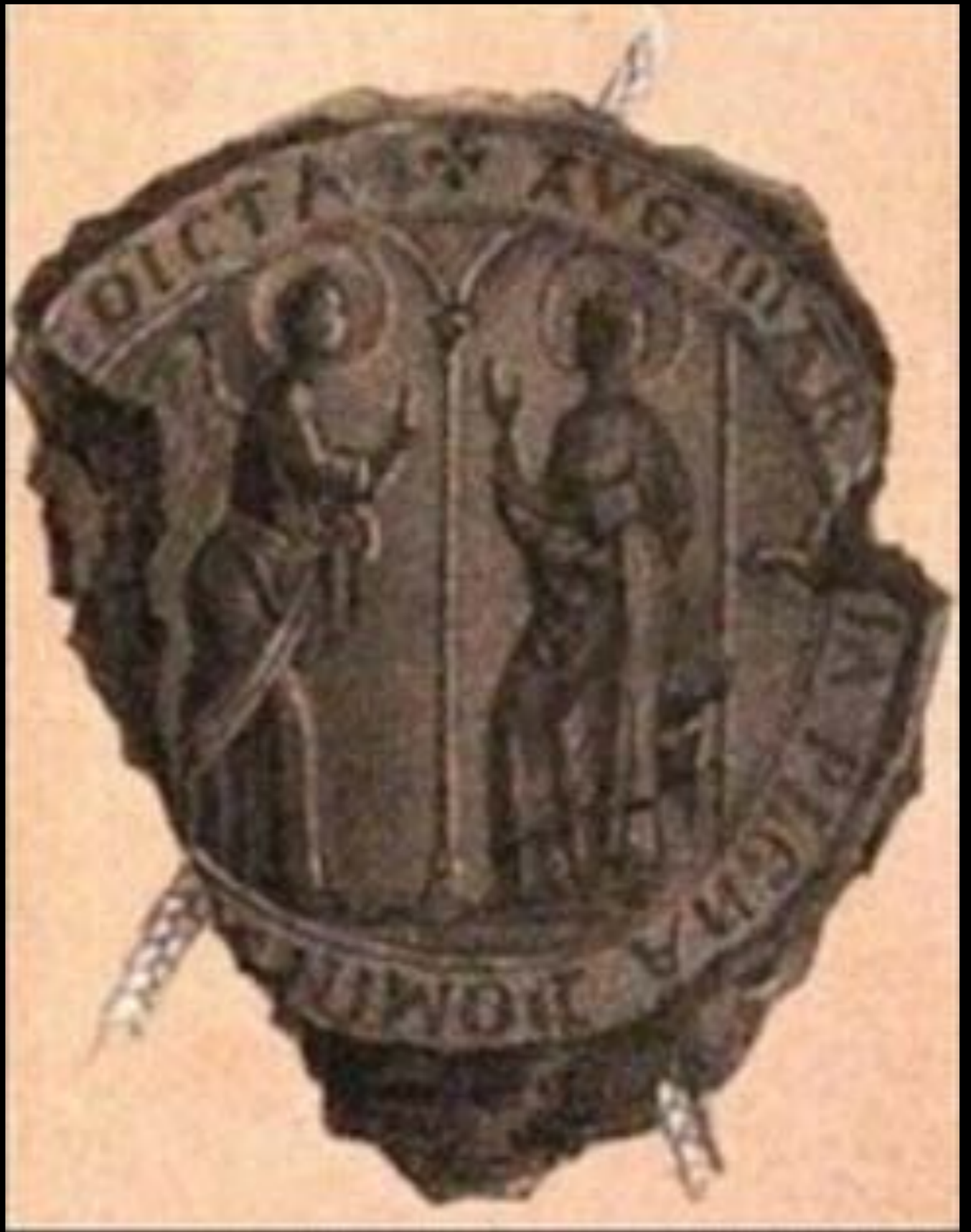
Seal of the Cathedral, 13th century