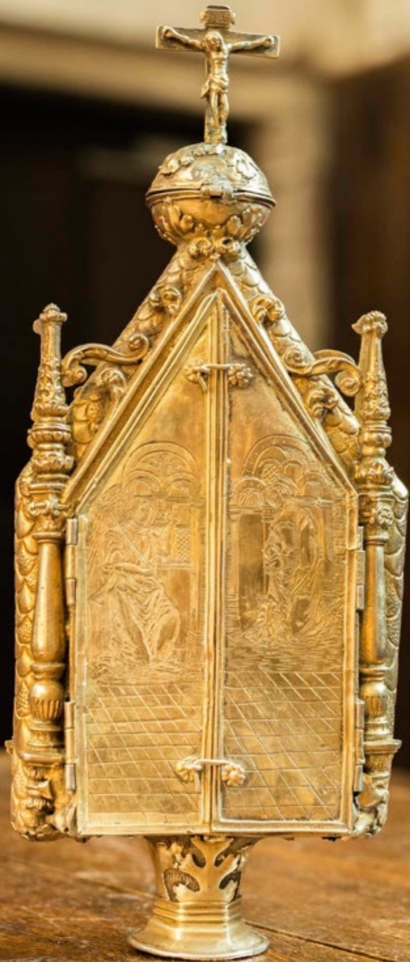
Reliquary- Sacristy, 16th century